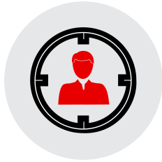
Recruiting y staffing