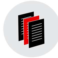
Asesoría legal laboral