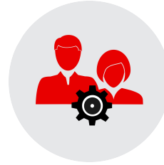
Onboarding y dinámica